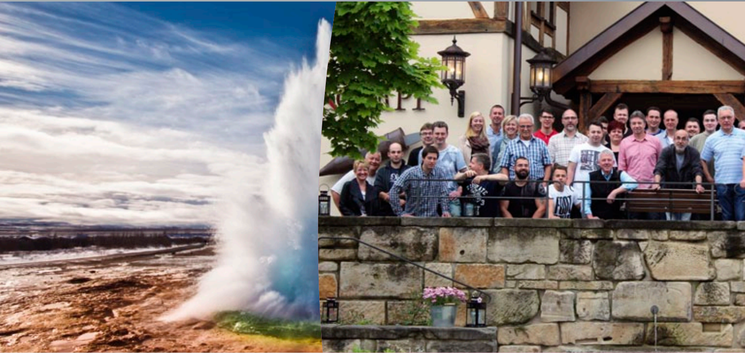
Abschluss des Firmen-Aus

Der Kurs jedes Technik-Unternehmens liegt irgendwo zwischen den im Silicon Valley sprudelnden Visionen und bewährter industrieller Fertigung. Dabei gilt es vor allem die richtige Geschwindigkeit auf dem Weg in die Zukunft zu finden – vor dem Markt zu sein ist nicht besser als von diesem überholt zu werden. Ja, man kann untergehen im Ozean der Möglichkeiten von Industrie 4.0 und digitaler Revolution. Umso wichtiger ist es, sich damit auseinanderzusetzen und den eigenen Weg zu finden, statt spontan auf Züge aufzuspringen. Hierbei hat uns auch die Teilnahme an der Initiative Ludwig Erhard Preis geholfen – die erhaltenen Bewertungen zeigten Möglichkeiten in allen Tätigkeitsfeldern von RICH Präzision auf.